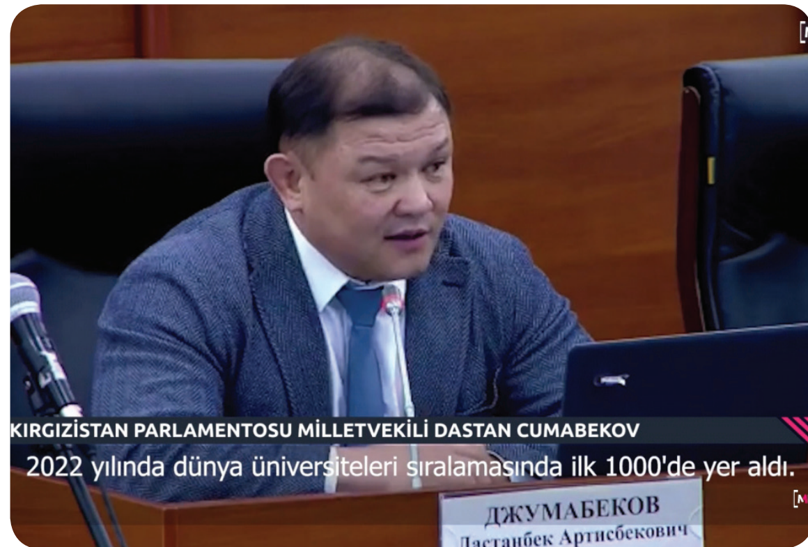
KIRGIZİSTAN PARLAMENTOSU MİLLETVEKİLİ DASTAN CUMABEKOV 2022 yılında dünya üniversiteleri sıralamasında ilk 1000'de yer aldı.

kiye Cumhuriyeti arasında İzmir'de imzalanan anlaşmayla kuruldu. Manas, özel statülü bir devlet üniversitesi olarak 1997'den bu yana Kırgızistan'ın başkenti Bişkek'te faaliyet gösteriyor.