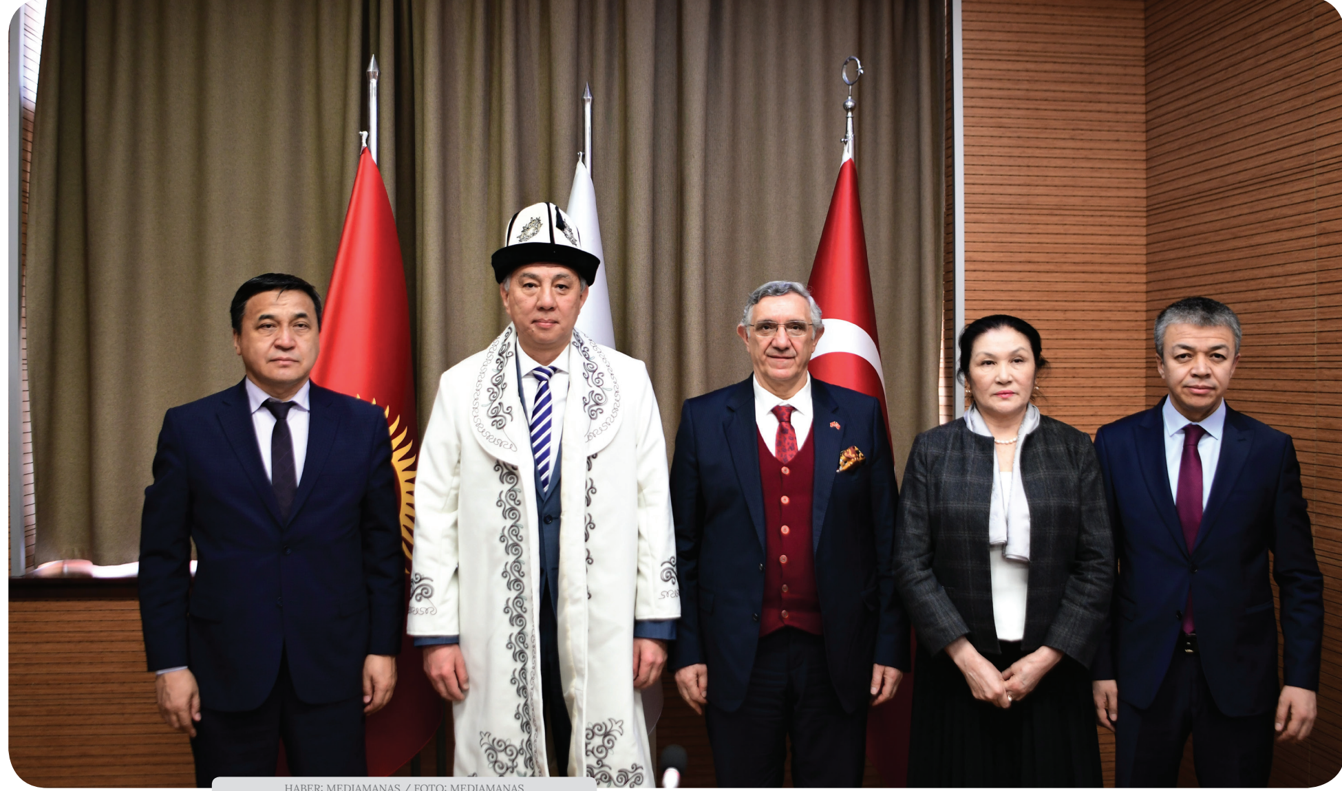
HABER: MEDIAMANAS

Kırgız Cumhuriyeti Eğitim ve Bilim Bakanı Kanıbek İmanaliyev ve Bakan Yardımcısı Rasul Avazbek Uulu'nun katılımıyla 2 Mart 2023'te devir teslim töreni düzenlendi.