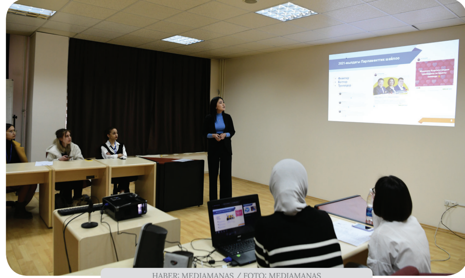
HABER: MEDIAMANAS / FOTO: MEDIAMANAS

Kırgızistan-Türkiye Manas Üniversitesi'nde (KTMÜ) "Değişen Dünyada Dijital İletişim Dönüşümü" konulu Uluslararası Öğrenci Konferansı düzenlendi.