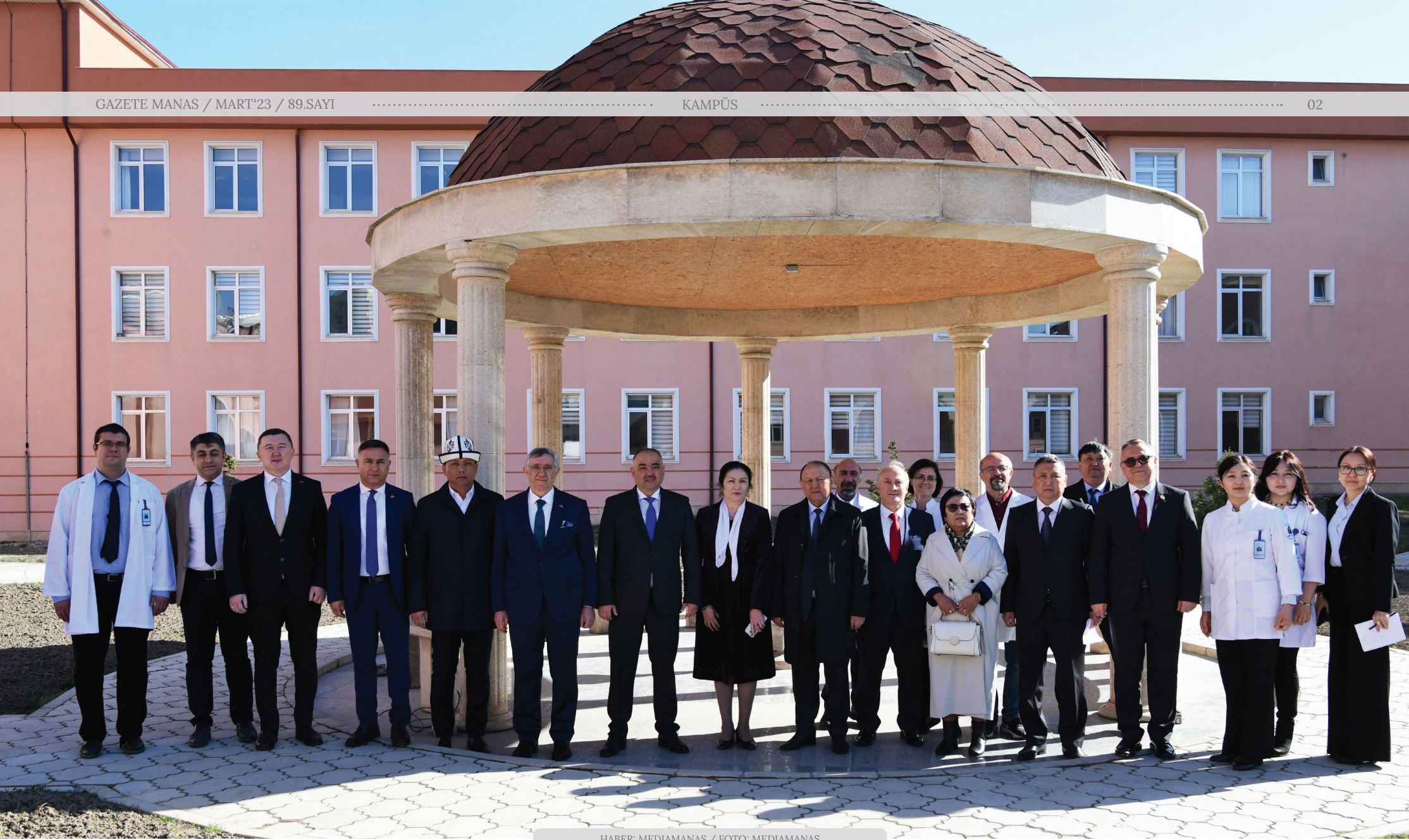
HABER: MEDIAMANAS