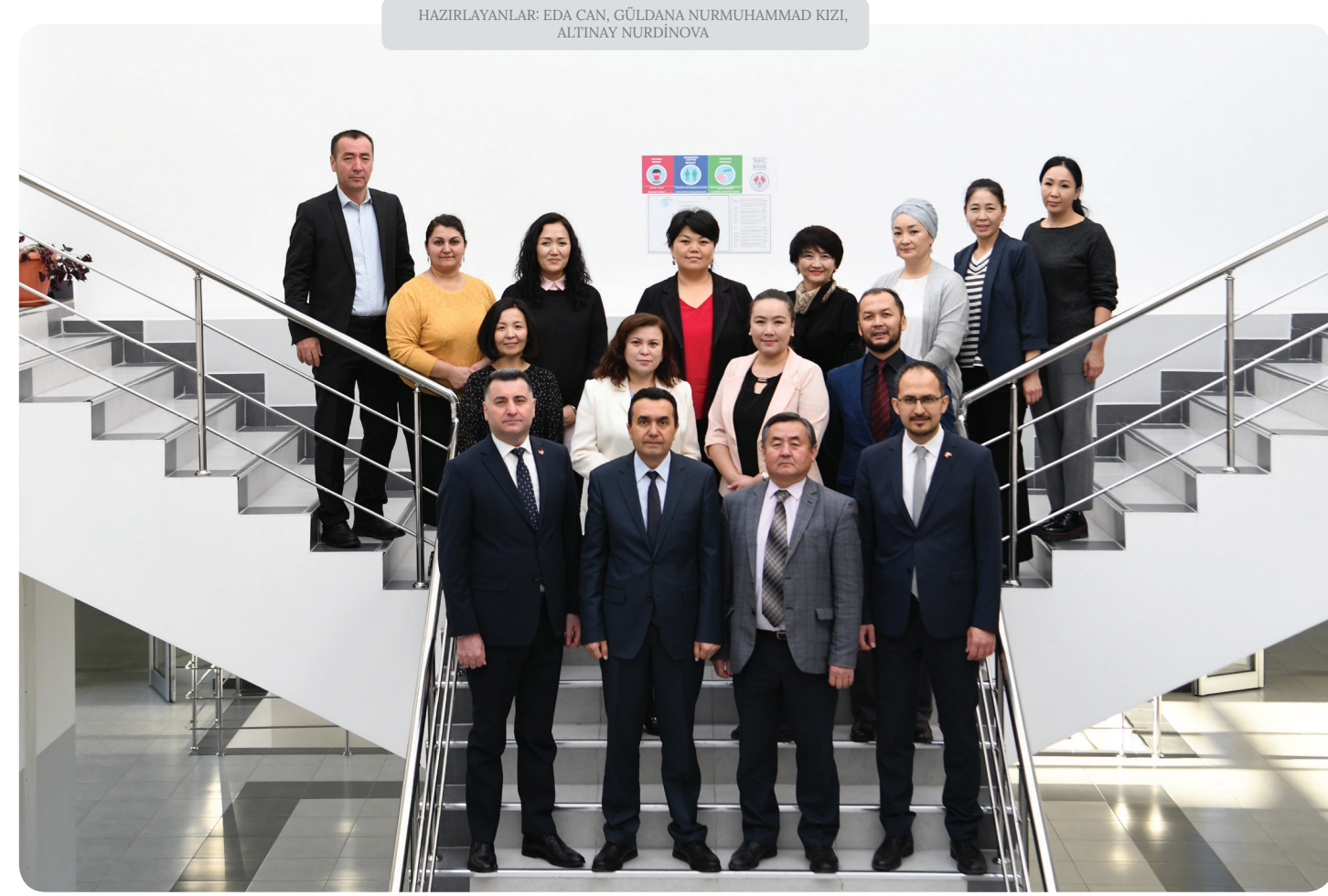
HAZIRLAYANLAR: EDA CAN, GÜLDANA NURMUHAMMAD KIZI, ALTINAY NURDİNOVA

lıyor hem de uygulamalı çalışmalar yapıyor"