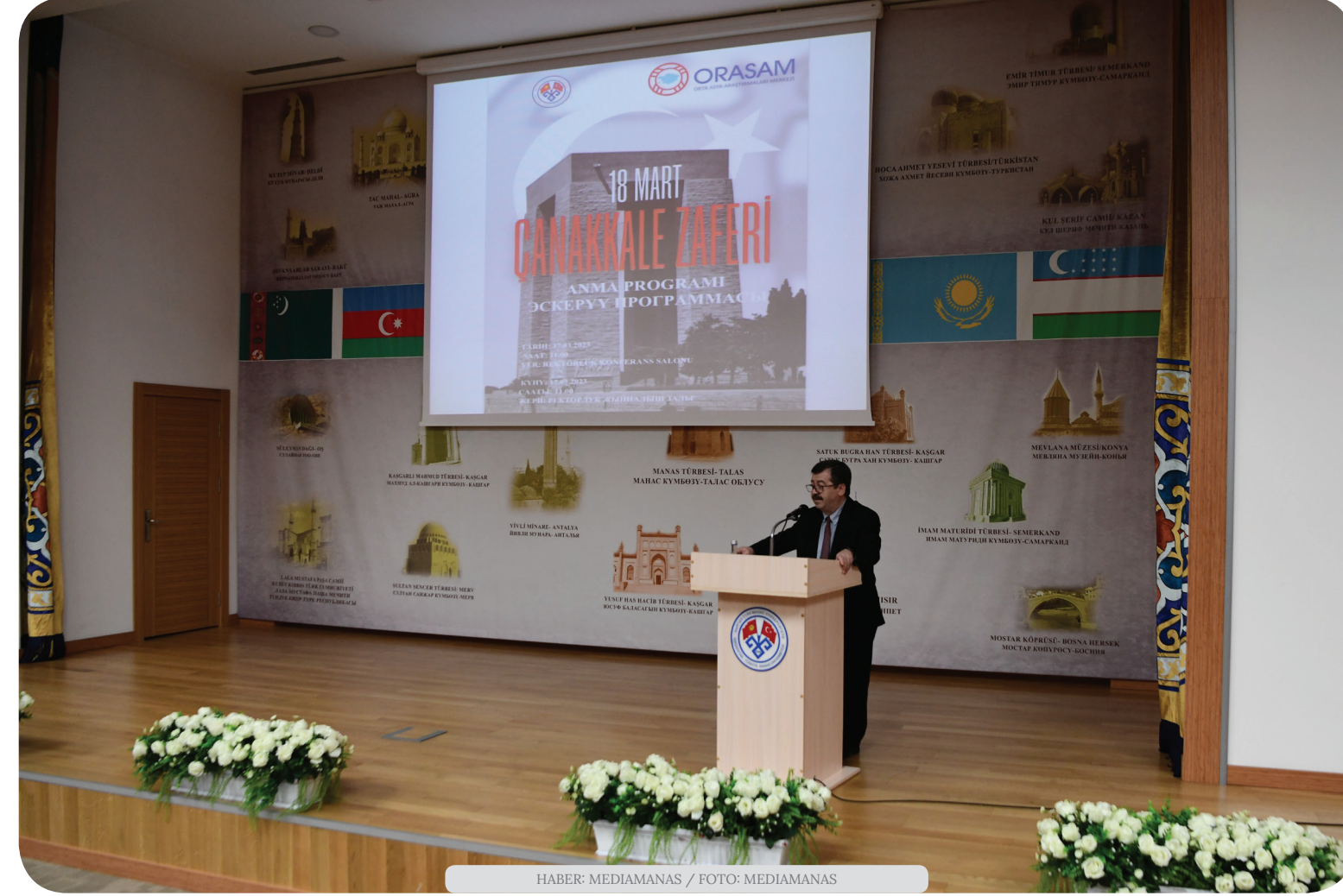
HABER: MEDIAMANAS

Kırgızistan-Türkiye Manas Üniversitesi'nde "18 Mart Çanakkale Zaferi ve Şehitleri Anma Günü" programı düzenlendi.