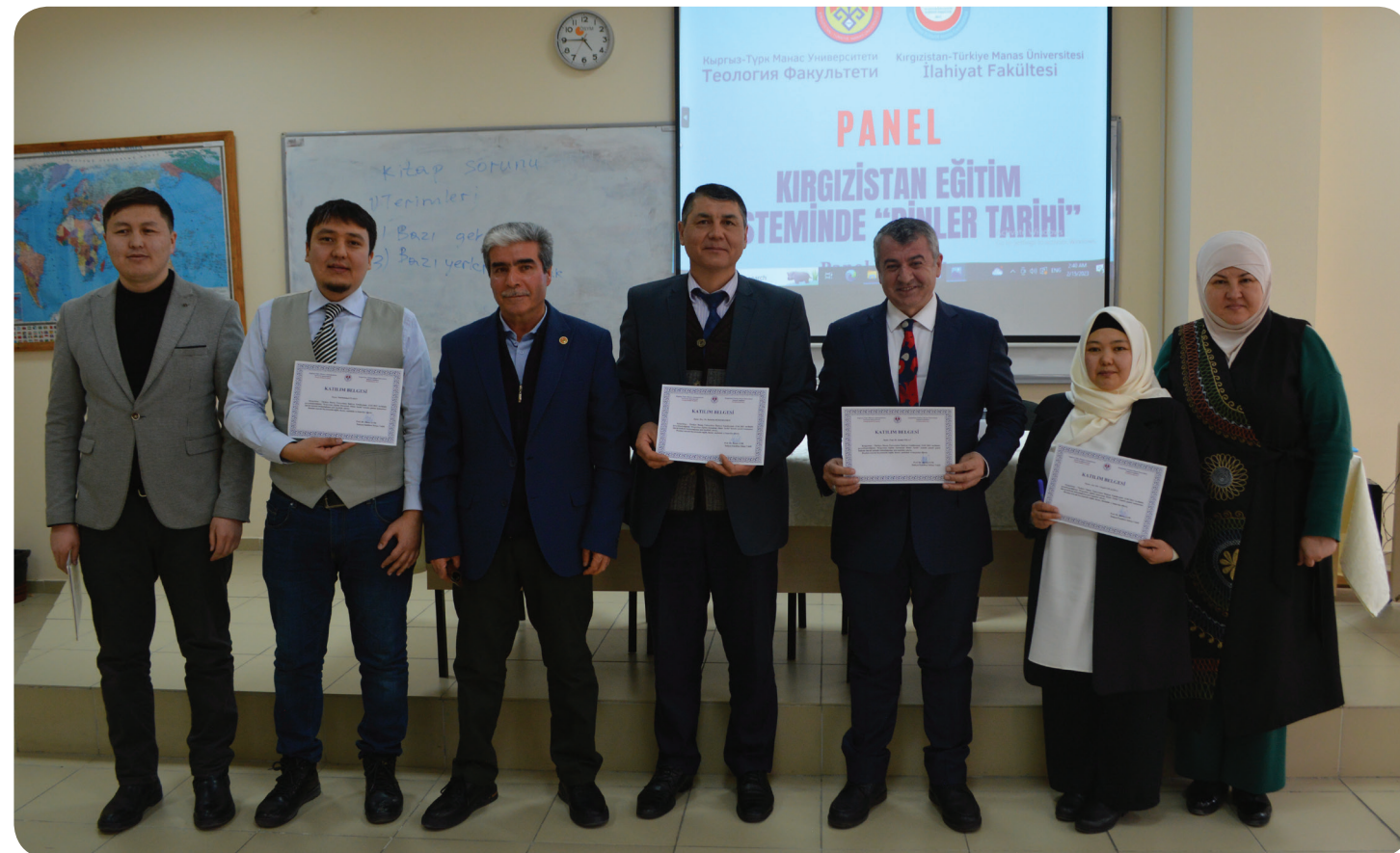
HAZIRLAYANLAR: ESENBOL, NURBEK UULU, ÇAKŞILIK ZAMIRBEKOV