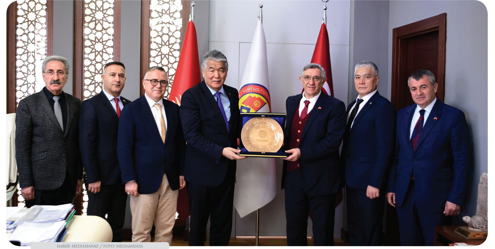
HABER: MEDIAMANAS